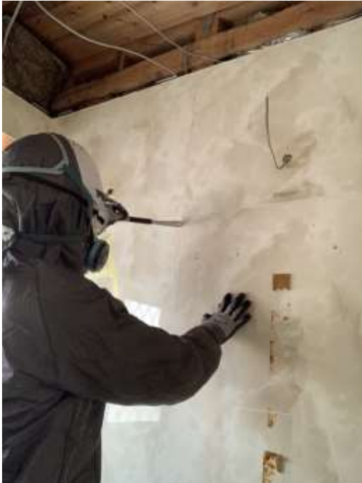
パネル接合部から撤去