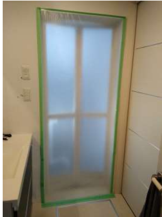
マスカーを使った養生