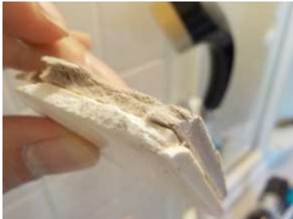
下地材が石綿含有