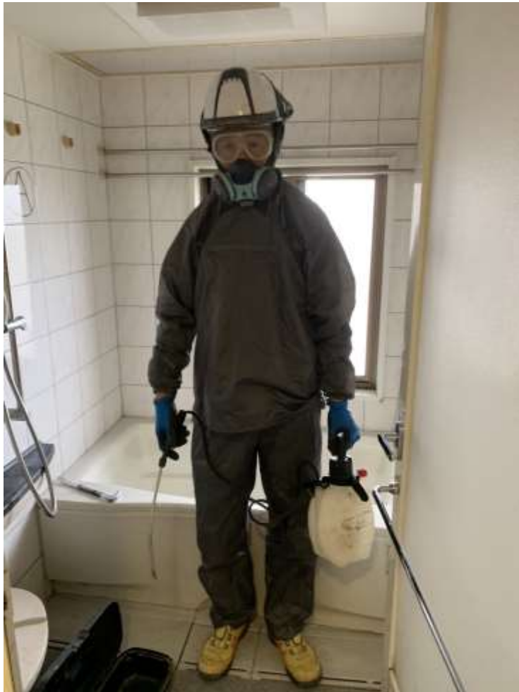
ツルツルした素材の選択