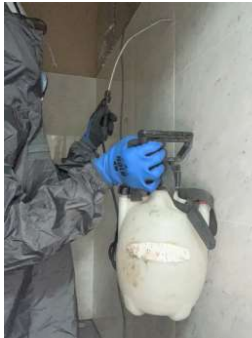
パネル接合部に湿潤化