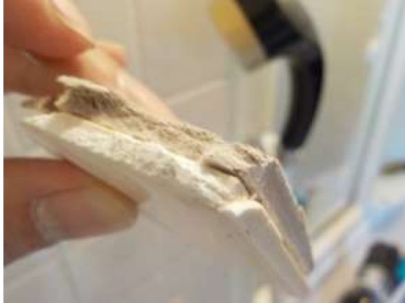
下地材が石綿含有